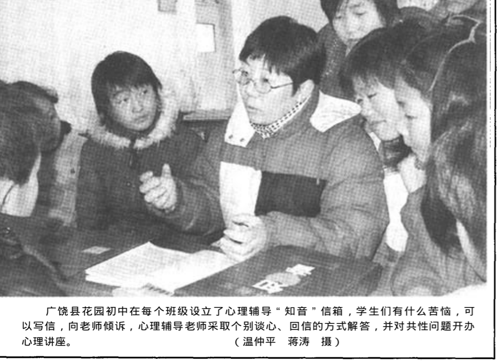
广饶县花园初中在每个班级设立了心理辅导“知音”信箱,学生们有什么苦恼,可以写信,向老师倾诉,心理辅导老师采取个别谈心、回信的方式解答,并对共性问题开办心理讲座。