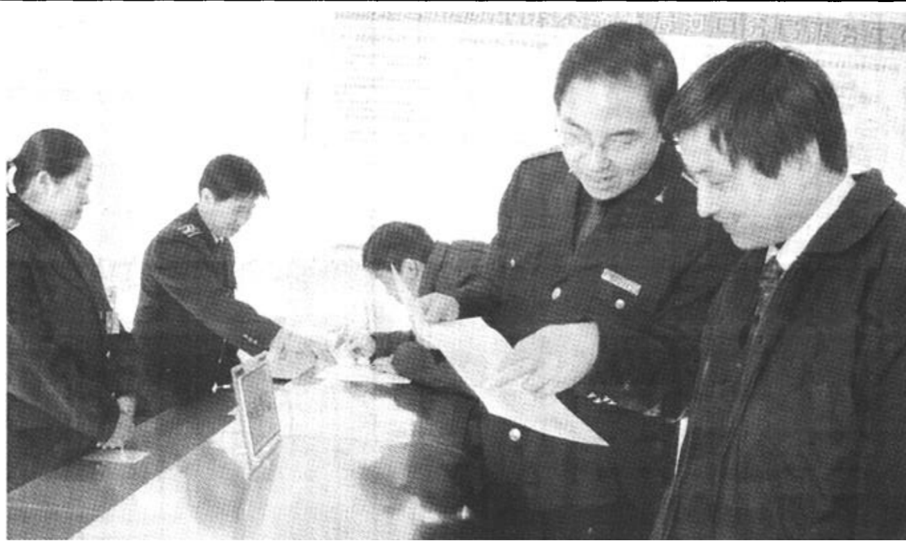
河口质监分局实行班子成员集中办公制度,以进一步加强与企业及消费者的联系,及时听取意见,更好地开展服务。