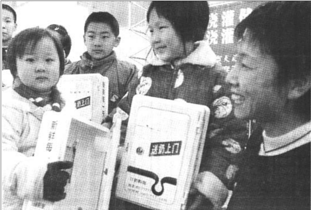
1月16日,几名家住北京市福绥靖地区的孩子领到一个订购箱。春节前夕福绥靖街道团工委、妇联、工会联合开展羊年新春送温暖系列活动。从当天开始的一年内,该地区30多位家庭的孩子每天都可以免费喝上北京天福号食品厂为他们订购的牛奶。

公司,已通过收购、兼并、租赁等形式,纷纷在中国设立分厂。目前,已有近400个进口保健食品获得批准,相继登陆我国保健食品市场,在不经意间形成了一股强大的势力。据有关部门统计,近5年来,国外保健品在中国市场上的销售量每年均以12%以上的速度增长。