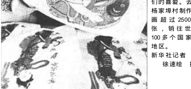
1月15日,在山东省潍坊市杨家埠村旅游的两名年轻游客(右、中)对杨家埠年画颇感兴趣。具有浓郁中国传统文化的杨家埠年画越来越受到人们的喜爱。

今后凡接受希望工程资助的特困生,都将获得当地农业银行储蓄所的一张希望工程助学金存折(卡),每学期开学时,由中国青少年发展基金会直接将助学金汇入受助生的存折(卡)中。