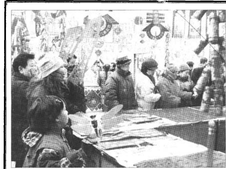
1月16日,不少顾客在天津市古文化街选购新年福联。虽然离农历羊年新年还有一段时间,天津古文化街的商家已将玩的、看的、摆的各色年货摆满店门外,琳琅满目、红红火火的年货让津门人早早感受到了浓浓的节日气氛。